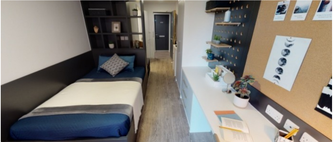
Résidence IQ Shoreditch

À partir de 700 € par semaine (selon les dates de votre séjour)