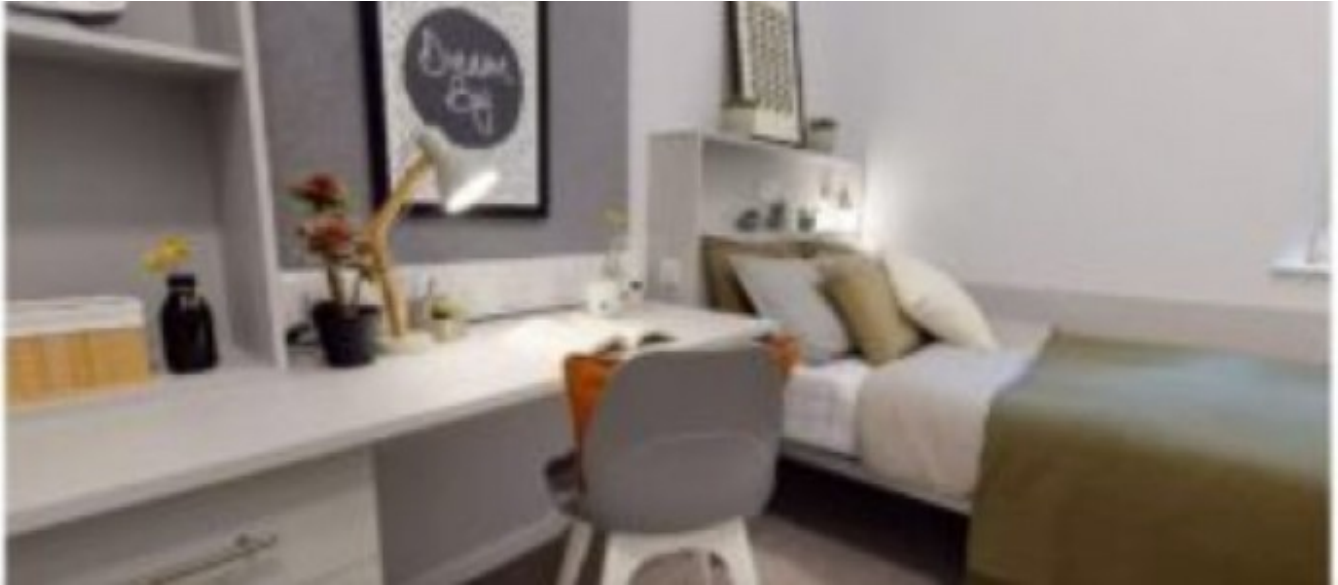
Résidence Supérieure IQ Will Wyatt À partir de 575 € par semaine (selon les dates de votre séjour)