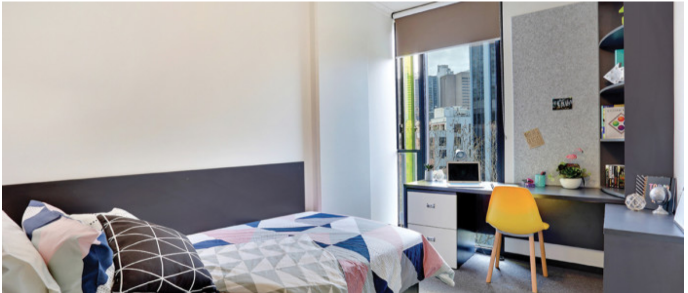
Appartement partagé Premium (18+)

À partir de 415 € par semaine (selon les dates de votre séjour)