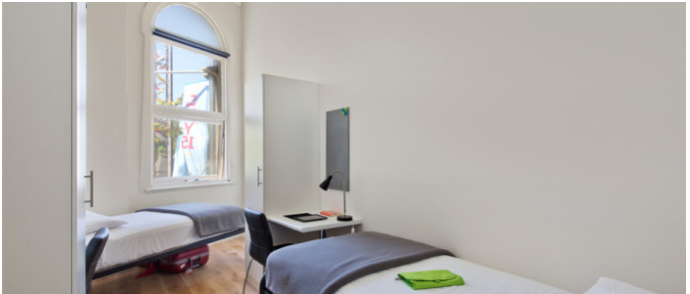
Résidence LINK (18+)

À partir de 288 € par semaine (selon les dates de votre séjour)