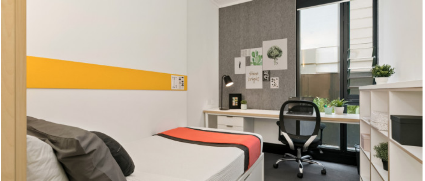
Résidence Iglu (18+)

À partir de 355 € par semaine (selon les dates de votre séjour)