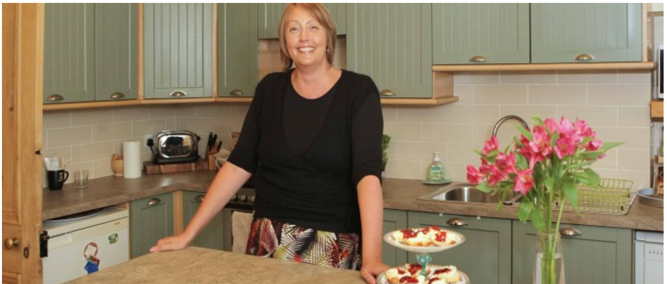
Hébergement chez l'habitant