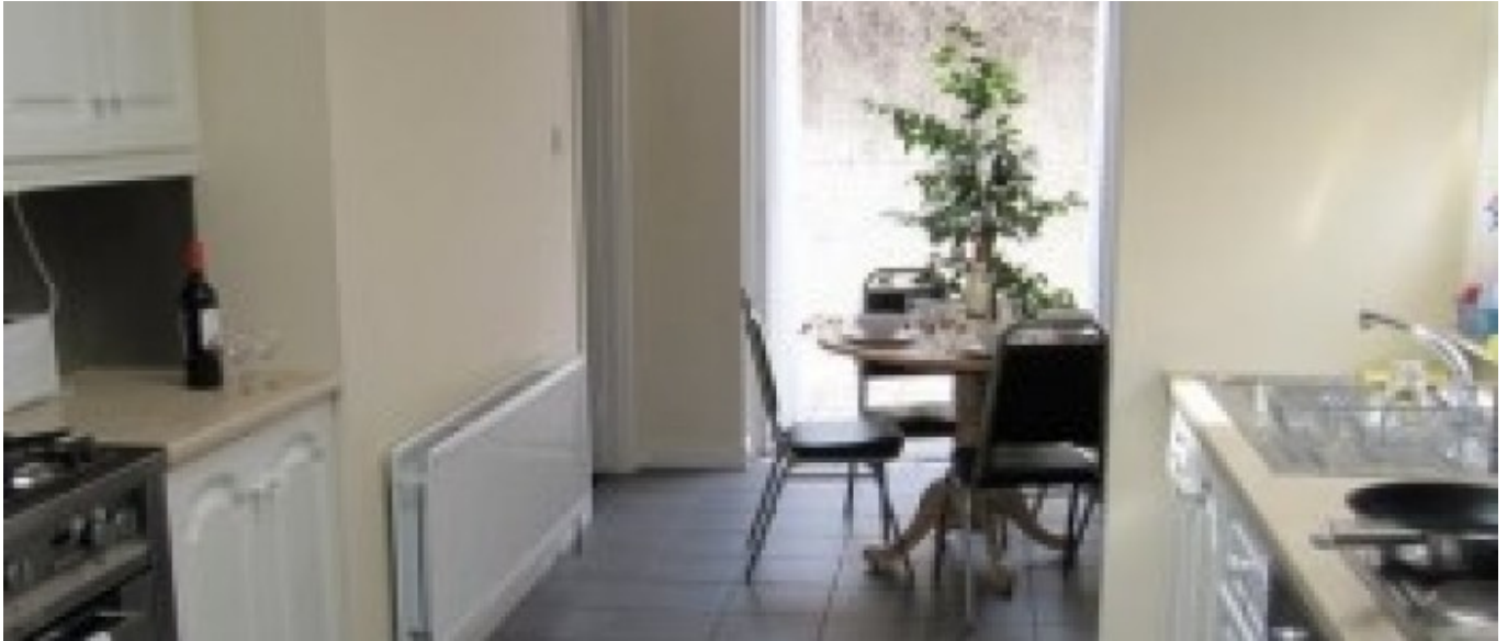
School City Residence

Cette résidence est située à 2 minutes à pied de l'école.