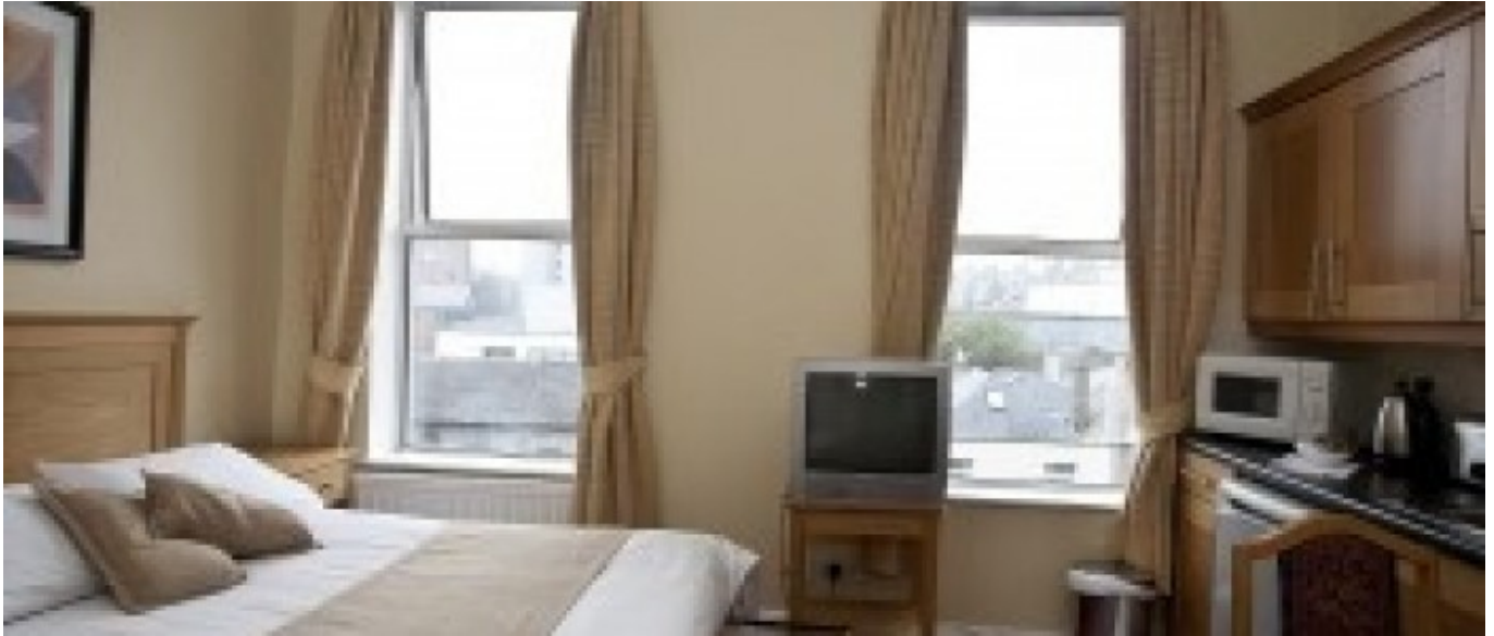
Baggot city residence

À partir de 358 € par semaine (selon les dates de votre séjour)