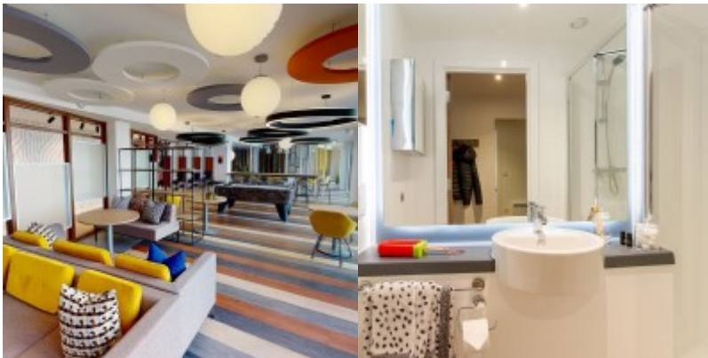
Résidence ultra)moderne de grand confort, à 2 minutes à pied de notre école !