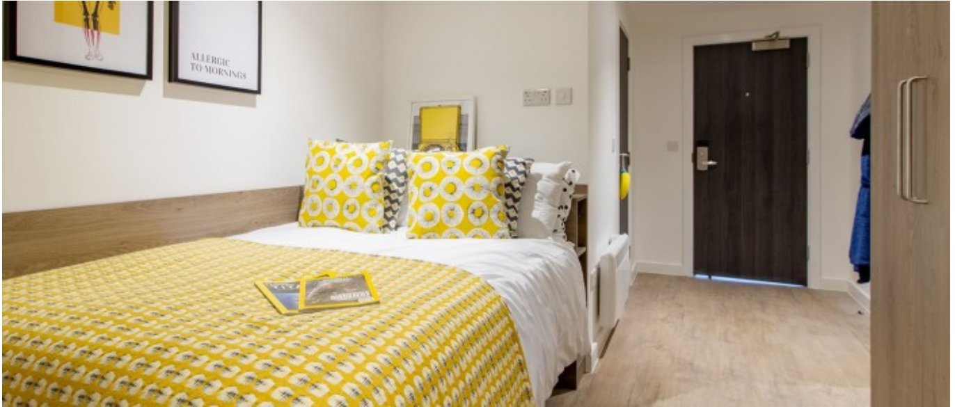
Résidence sur le campus 18+ À partir de 460 € par semaine (selon les dates de votre séjour)