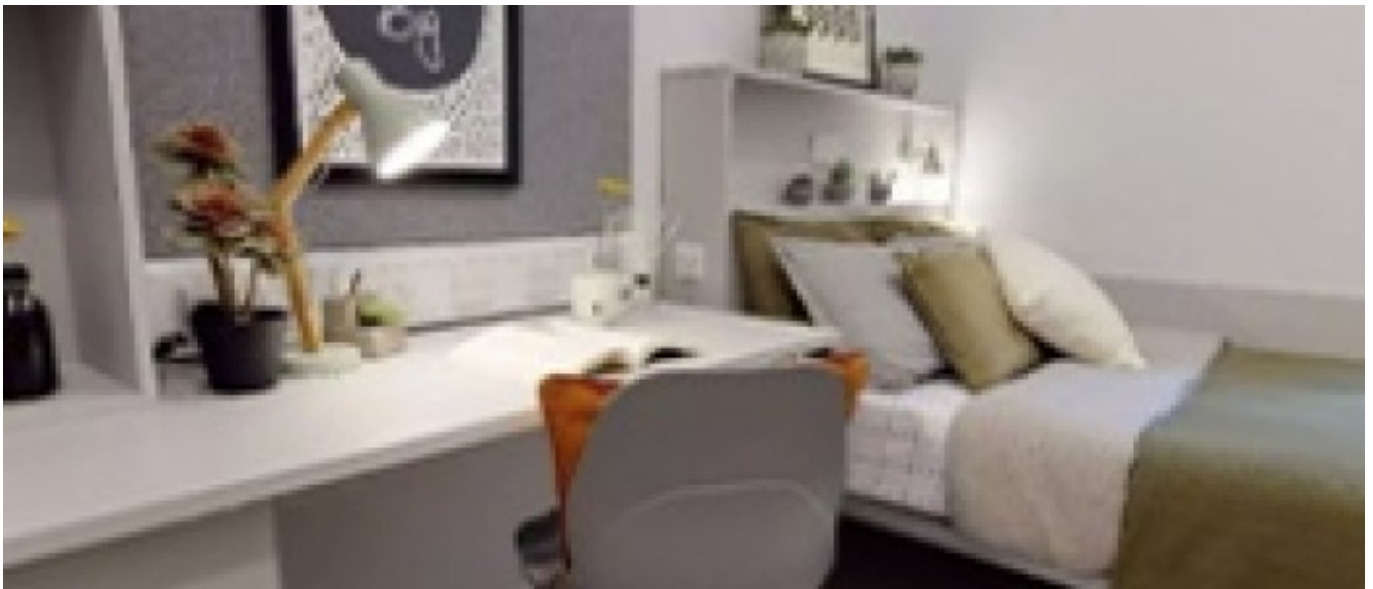
Résidence Supérieure IQ Will Wyatt (à partir de 18 ans) À partir de 575 € par semaine (selon les dates de votre séjour)