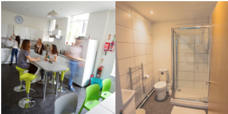
Résidence accessible à partir de 18 ans

À partir de 350 € par semaine (selon les dates de votre séjour)