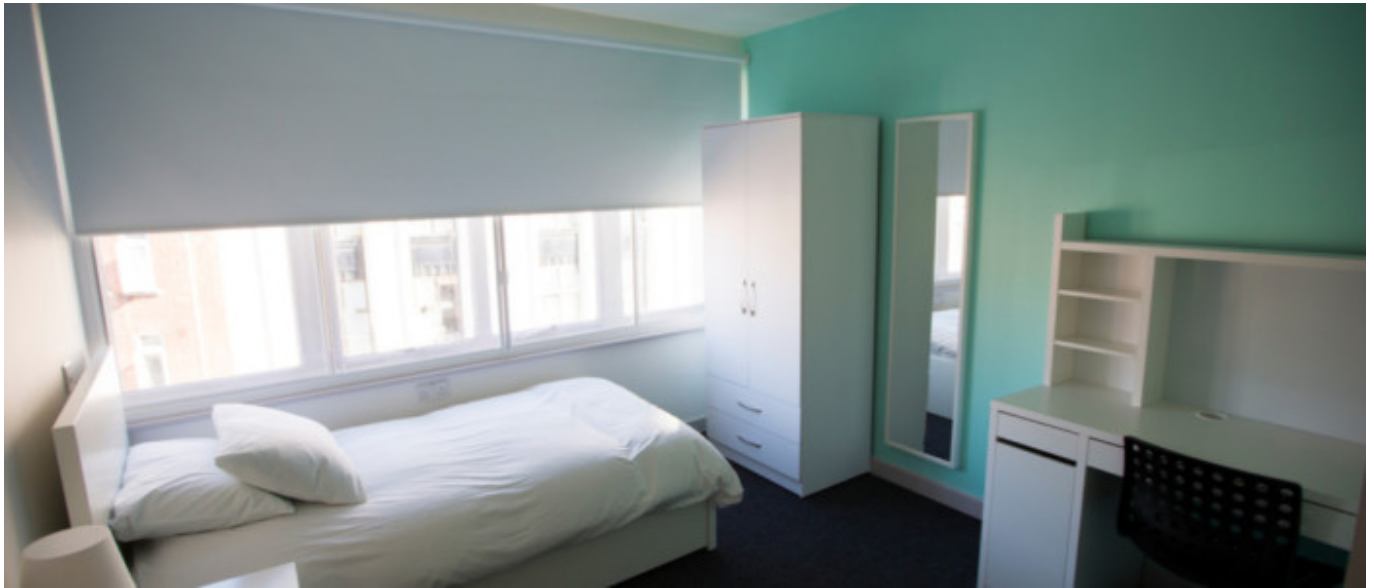
Résidence en centre ville 18+

À partir de 350 € par semaine (selon les dates de votre séjour)