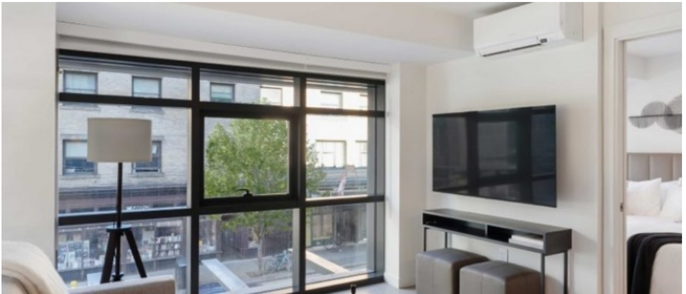
Appartements partagés Richard & Pender À partir de 415 € par semaine (selon les dates de votre séjour)

Toutes les familles d'accueil sont à moins de 60 minutes de trajet par transport public jusqu'à l'école.