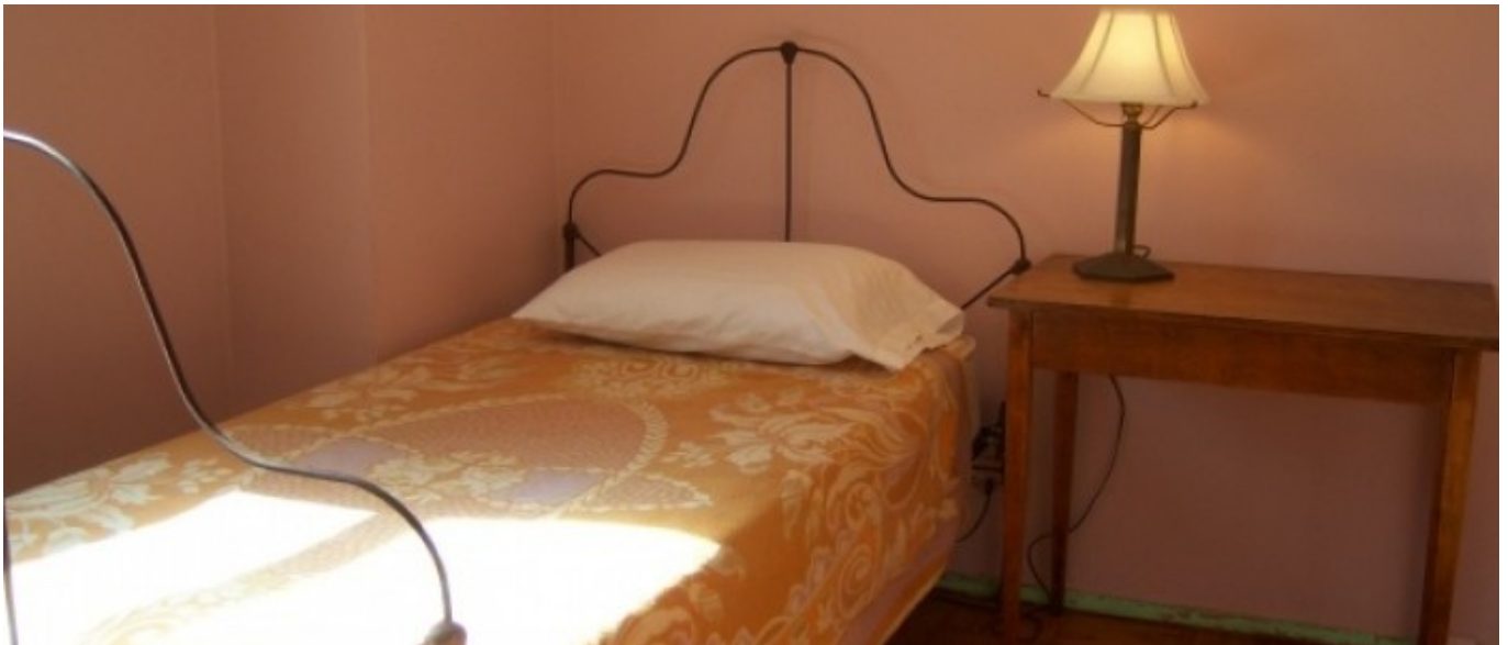
Hébergement chez l'habitant (18 ans et +) À partir de 470 € par semaine (selon les dates de votre séjour)