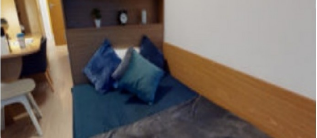
iQ Bristol Residence

À partir de 495 € par semaine (selon les dates de votre séjour)