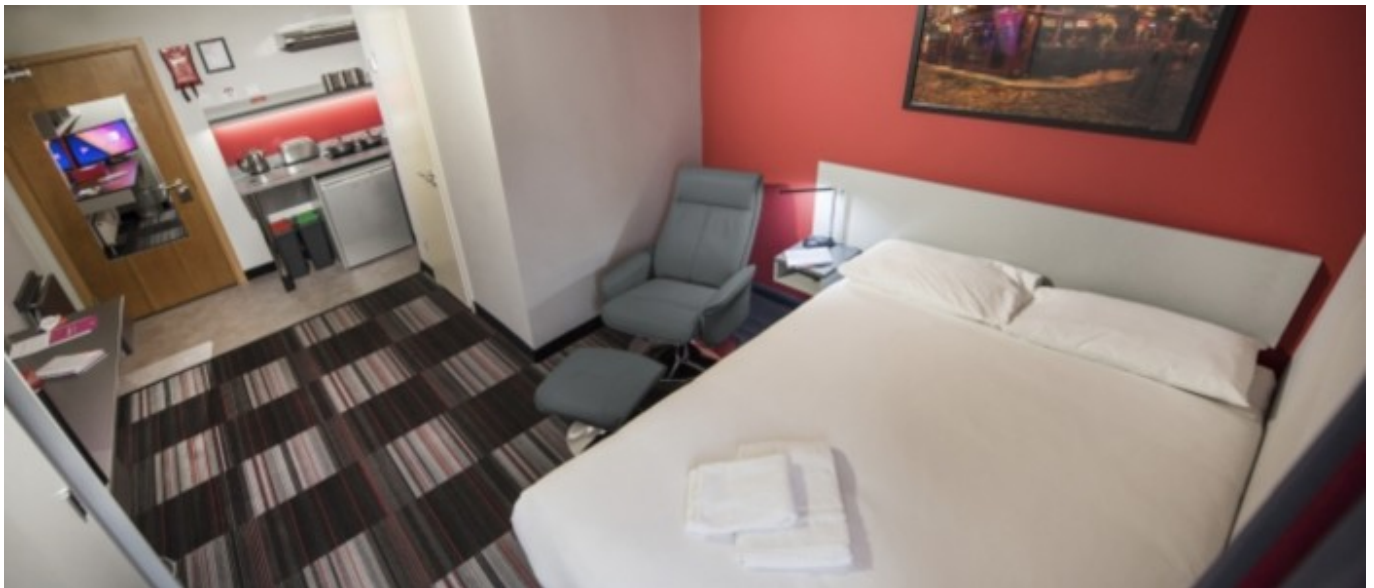
Castle Street residence

À partir de 515 € par semaine (selon les dates de votre séjour)