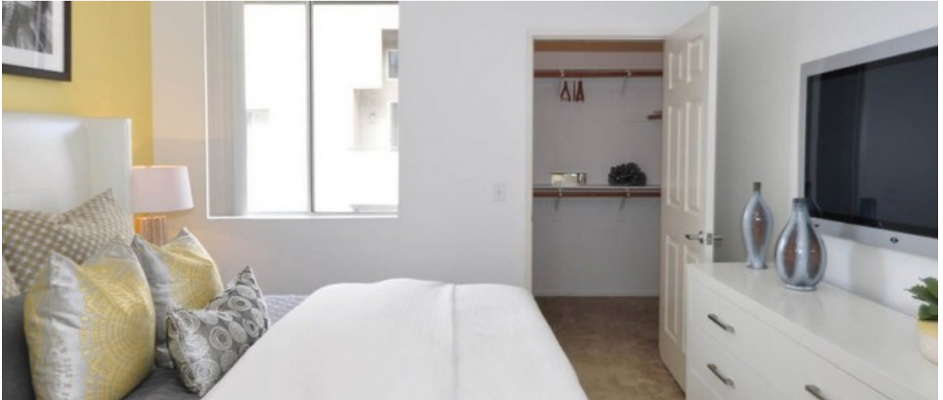
Appartements partagés Costa Verde À partir de 390 € par semaine (selon les dates de votre séjour)