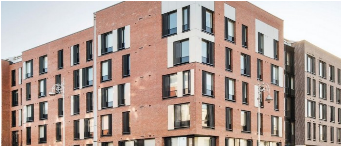
Kavanagh Court Studio

À partir de 415 € par semaine (selon les dates de votre séjour)