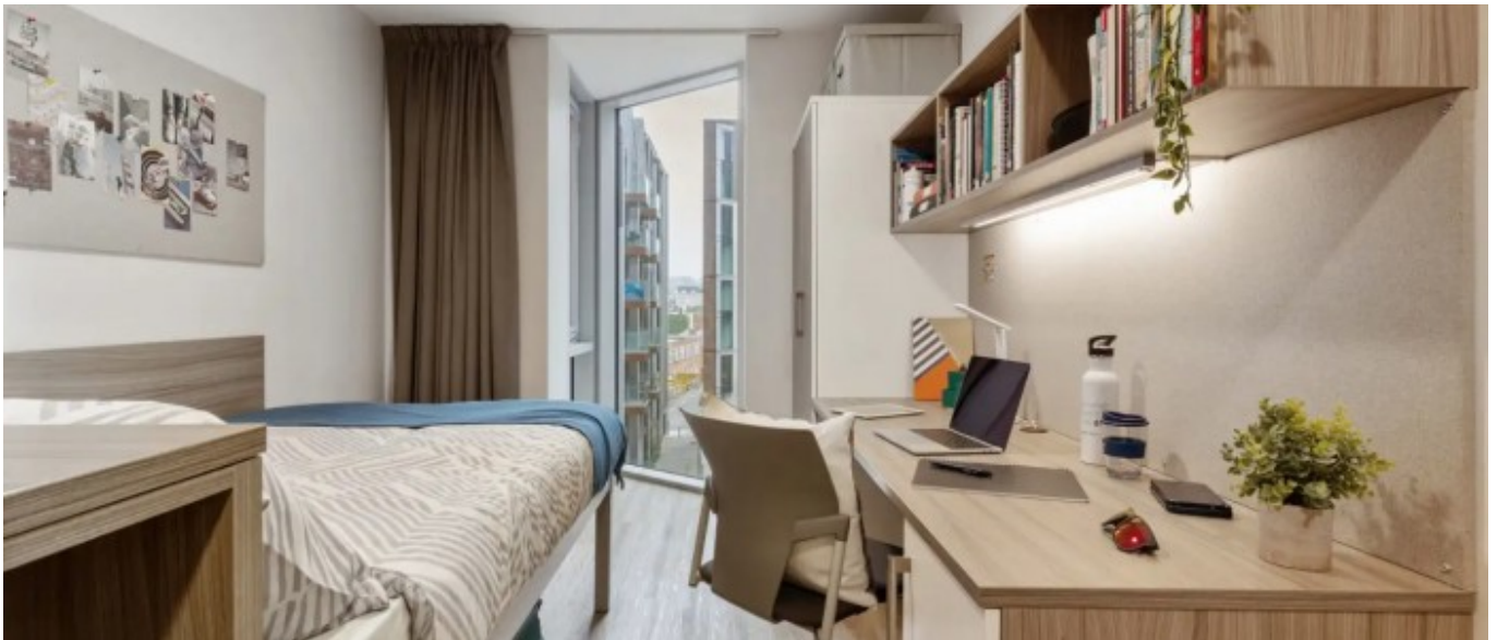
North Laine residence

Ou alors 10 minutes par transport public.